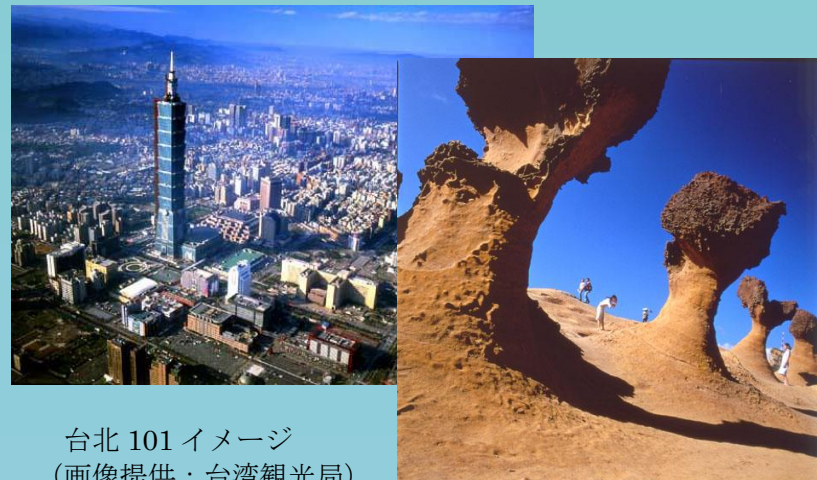
台北101イメージ