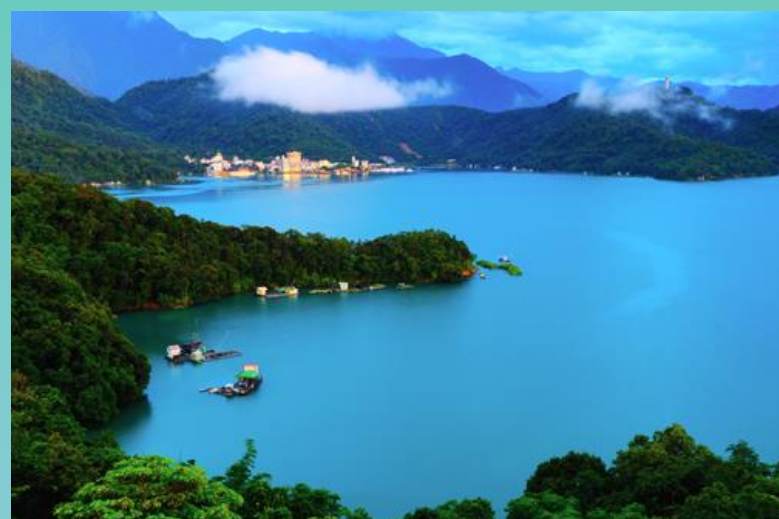
日月潭イメージ

美祢市・台湾との交流事業の一環として、山口宇部空港・台湾チャーター便を活用し、市民の皆様実際に現地を体験いただき、台湾との相互交流を目指します。交流協定を結んでいる南投県・水里郷、野柳地質公園等の観光地も訪問します。