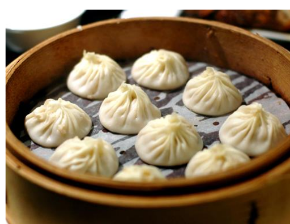
小籠包イメージ

ご旅行条件(要約) お申し込みの際には、必ず旅行条件書(全文)をお受け取りいただき、事前にご確認の上お申し込みください。