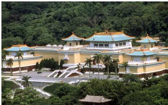
故宮博物院イメージ