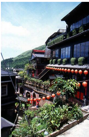
九份イメージ